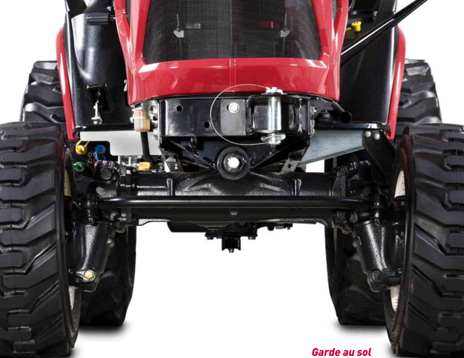
Garde au sol