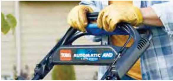
TRANSMISSION AUTOMATIC DRIVE AVEC POIGNÉE ASSISTÉ

— PREND JUSQU'À — 70% MOINS D'ESPACE DANS VOTRE GARAGE